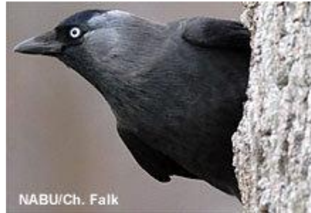
Die Dohle – Vogel des Jahres 2012

www.nabu.de www.naju.de www.niedersachsen.nabu.de www.hamburg.nabu.de www.schleswig-holstein.nabu.de www.nabu-winsen-luhe.de www.nabu-hanstedt.de